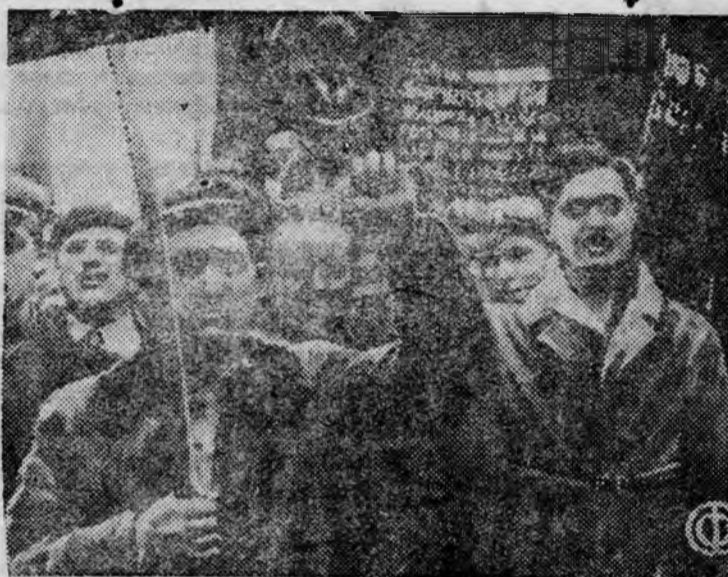
ПЕРВОЕ МАЯ В СТРАНАХ НАПИТАЛА

Дело Тельмана будет слушаться в новом фашистском „народном суде“ исключаясь всякую возможность защиты. О своей готовности выступить на суде в защиту Тельмана заявили сотни иностранных адвокатов.