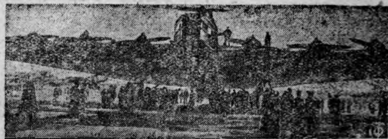
Величайший в мире Агитсамолет имени великого пролетарского писателя Максима горького закончен постройкой. Самолет конструкции инженера А. Н. Туполева, оборудован семью моторами, размах крыльев—65 метра, длина корпуса—35 метров. Колеса в диаметре в рост человека, 2-метра. На самолете будут помещаться: печатная типография, передающая радиостанция и т.д. Самолет предназначен для агитсамолетов по городам, рабочим районам и колхозам.

„Максим Горький“—активная действующая единица, являющаяся новым средством массовой агитации и располагающая для этого всеми необходимыми техническими средствами. „Максим Горький“—комплекс наших достижений и показ их.